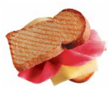
TIROLER TOAST TOAST TIROLESE